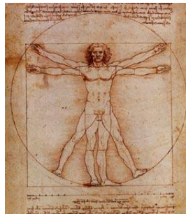
Léonard de Vinci, proportion de l'homme (1492) Venise, Galerie de l'Académie