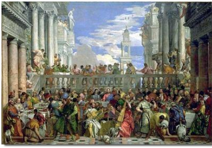
Veronèse, Les noces de Cana (1562-1563) Paris, Musée du Louvre