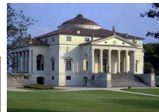
Palladio, Villa rotonda (1568-1571) Près de Vicenze