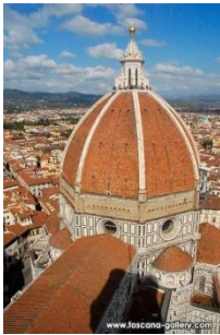
Dôme de Brunelleschi Santa Maria del Fiore Florence