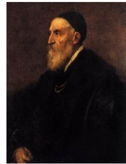
Titien, Autoportrait (1566) Prado, Madrid