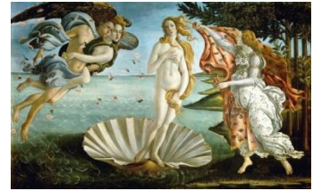
Botticelli, la naissance de Vénus (1485) Musée des Offices, Florence