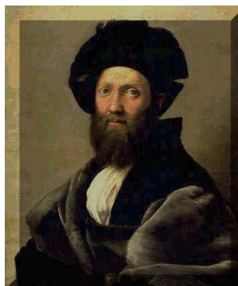
Raphaël, portrait de Baldassar Castiglioni (1515) Paris, Musée du Louvre